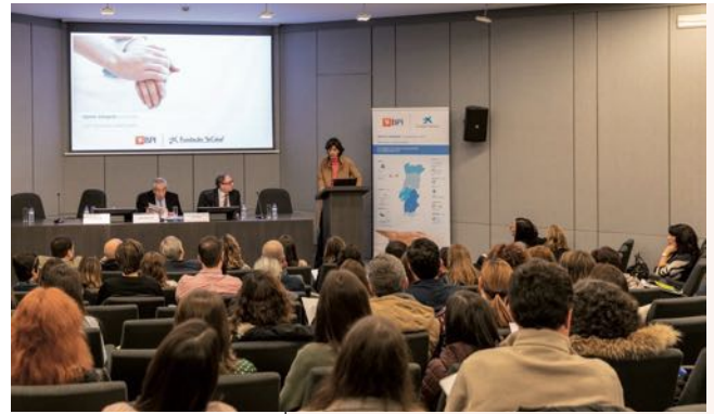
Sessão do programa Humaniza em Portugal.

«O meu trabalho é contribuir para canalizar todas as angústias no momento em que o doente sente a ameaça da sua própria existência».