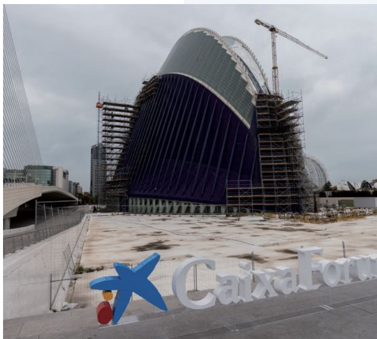
O futuro CaixaForum València terá 6.500 m 2 .

Exposição Robert Capa a cores no CaixaForum Tarragona.