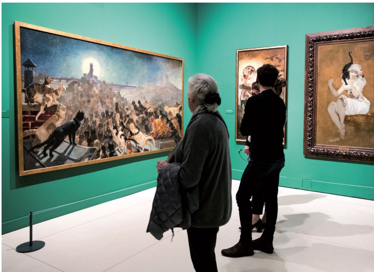
Visitantes na exposição Toulouse-Lautrec e o espírito de Montmartre no CaixaForum Madrid.