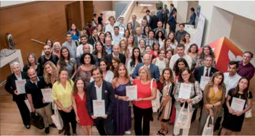
Entrega de los Premios BPI Fundación "la Caixa" 2019.