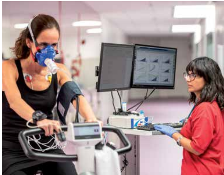
En 2019, se han seleccionado 25 iniciativas de excelencia científica en la Convocatoria de Ayudas para la Investigación en Salud.

Finalmente, cabe destacar que este 2019 la Fundación "la Caixa" ha consolidado la colaboración con la Fundação para a Ciência e a Tecnologia de Portugal, así como la Fundación Luzón. Las dos instituciones han aportado, este año, más de 1 M€ para ayudar a financiar 3 de los 23 proyectos seleccionados. —