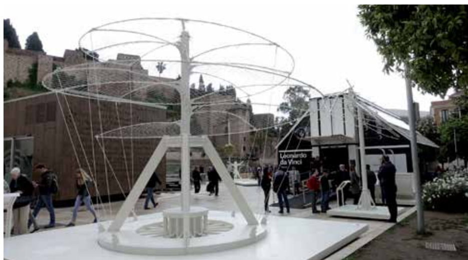
Exterior de la exposición Leonardo. Observa, cuestiona, experimenta.

Gracias a los acuerdos de colaboración con las administraciones locales de todo el territorio, las exposiciones itinerantes viajan a las diferentes ciudades y municipios, y cuentan con visitas comentadas para el gran público, así como para grupos escolares. La amplia oferta expositiva se complementa con un conjunto de actividades educativas y sociales en torno a las muestras, convirtiéndose así en un auténtico instrumento de dinamización social local.