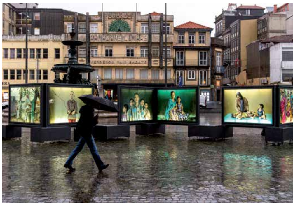
La muestra Tierra de sueños es uno de los nuevos proyectos de 2019.

De manera paralela, Creactivity ha continuado este año la itinerancia por el territorio. Este taller toma cuerpo en otro formato singular: un autobús que se convierte en un espacio educativo y familiar que fomenta la puesta en práctica de distintas habilidades. —