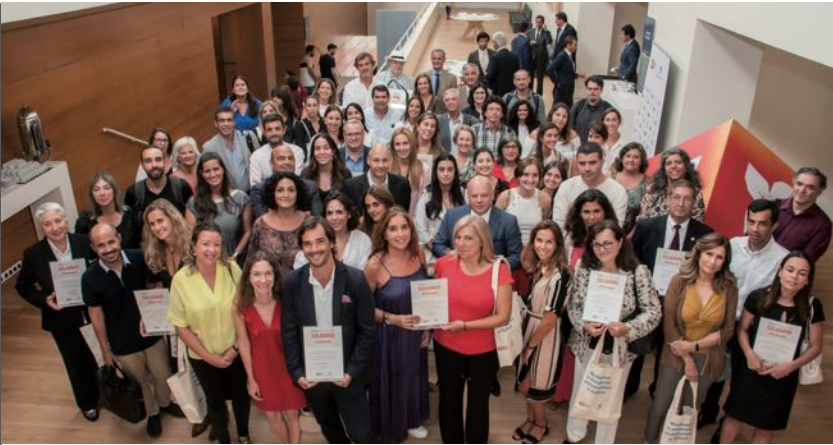
Lliurament dels Prémios BPI "la Caixa" 2019.