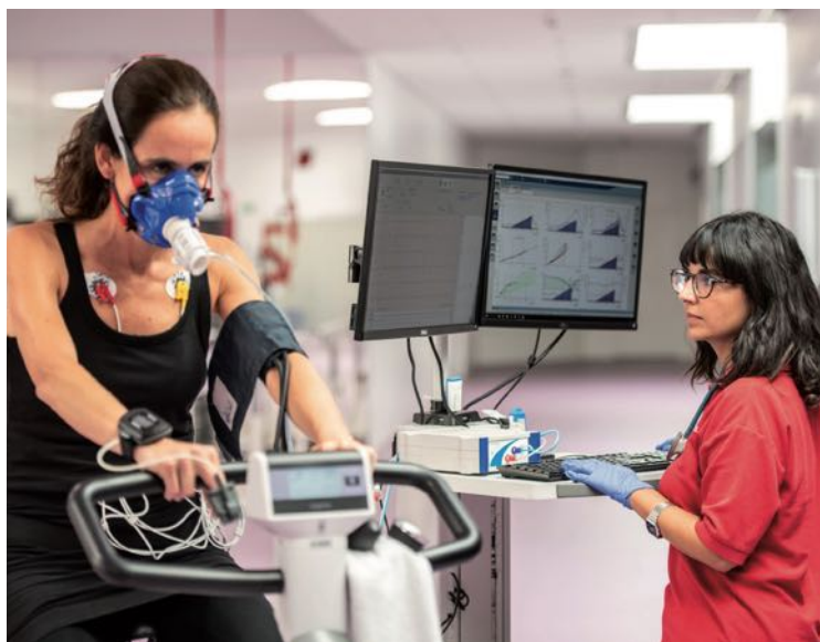
El 2019, s'han seleccionat 25 iniciatives d'excel·lència científica en la Convocatòria d'Ajudes per a la Recerca en Salut.

En la Convocatòria d'Ajudes per a la Recerca en Salut, s'han seleccionat aquest any 23 iniciatives d'excel·lència científica i amb gran valor potencial i impacte social. L'objectiu d'aquesta convocatòria, que és oberta i competitiva, és impulsar projectes d'excel·lència en la lluita contra les malalties de més impacte en el món. És per aquesta raó que la convocatòria ofereix ajudes en 5 àrees temàtiques: malalties cardiovasculars i malalties metabòliques associades; neurociències; malalties infeccioses; oncologia, i tecnologies facilitadores vinculades a algun dels àmbits anteriors. Aquest últim apartat és, precisament, una novetat que ha incorporat la convocatòria enguany. En total, la Fundació "la Caixa" ha destinat a aquesta convocatòria més de 15 M€.