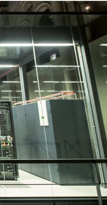
L'objectiu dels programes de beques és atreure i retenir talent investigador a Espanya i Portugal.

Finalment, no podem deixar de referir-nos al programa amb més tradició de tots: les beques de postgrau a l'estranger. Aquest programa permet als estudiants espanyols més excel·lents accedir a les millors universitats d'Europa, Amèrica del Nord (els EUA i el Canadà) i la zona d'Àsia-Pacífic (Austràlia, la Xina, Singapur, el Japó, l'Índia i Corea del Sud). Aquestes beques tenen una durada màxima de dos anys. —