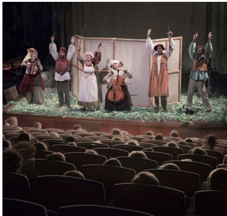
Concert escolar El col·leccionista de paisatges .

Escolars, famílies, gent gran i públic en general tenen cabuda en la programació musical de la Fundació "la Caixa".