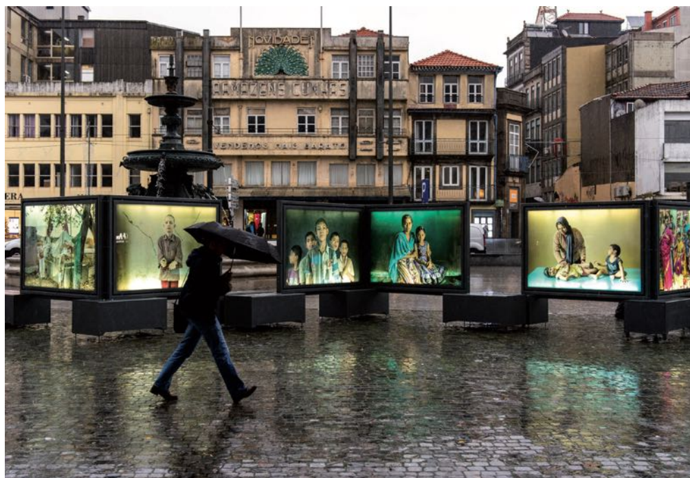
La mostra Terra de somnis és un dels nous projectes del 2019.

De manera paral·lela, Creativity ha continuat enguany la itinerància pel territori. Aquest taller pren cos en un altre format singular: un autobús que es converteix en un espai educatiu i familiar que fomenta la posada en pràctica de diferents habilitats. —