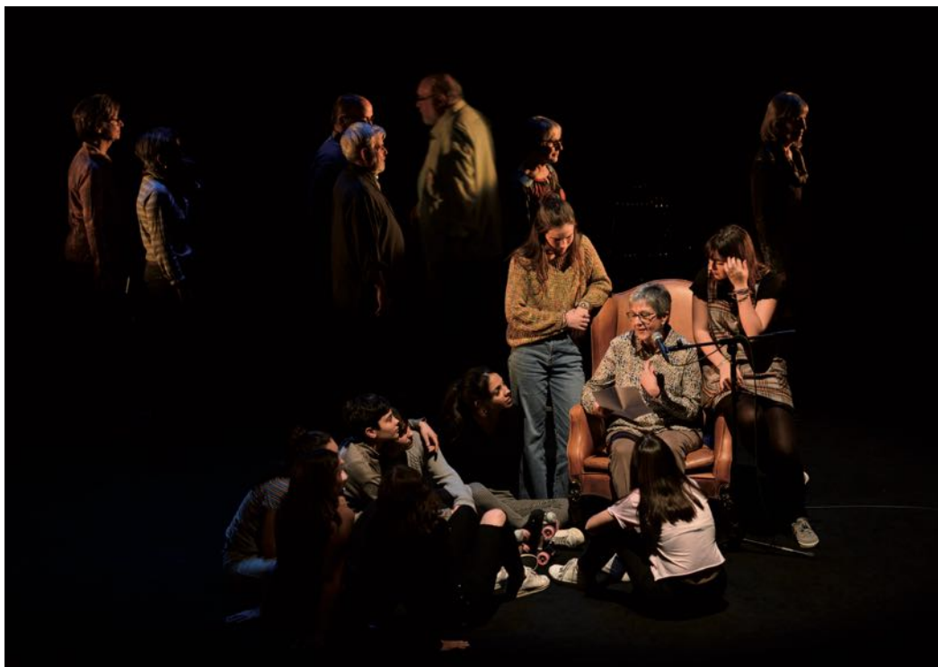
Espectacle Mateix dia, mateixa hora, mateix lloc , d'Art for Change "la Caixa".

De manera paral·lela, Art for Change "la Caixa" ha dissenyat un programa d'acompanyament als projectes seleccionats de la convocatòria per generar comunitat, aprenentatges i compartir experiències. Cal destacar la trobada Exchange Fòrum, que ha reunit un centenar d'artistes i gestors culturals a CaixaForum Barcelona per dialogar i identificar els temes rellevants al voltant de l'acció artística com a generadora de canvi social. —